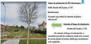
Plantación 100 alcornoques