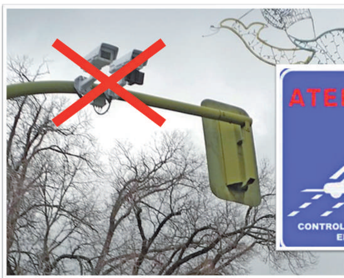
ELIMINACIÓN DE RADARES